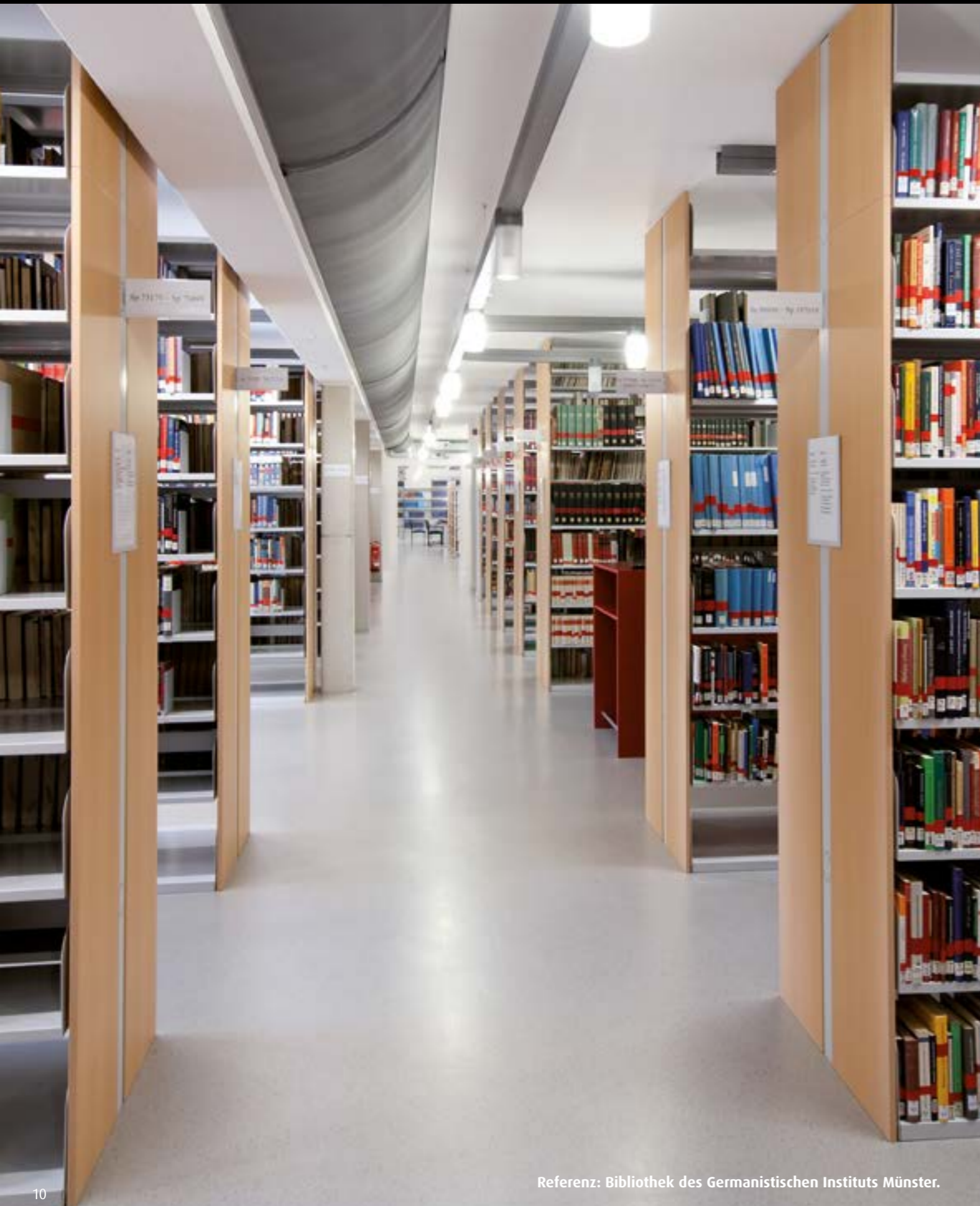
Referenz: Bibliothek des Germanistischen Instituts Münster.