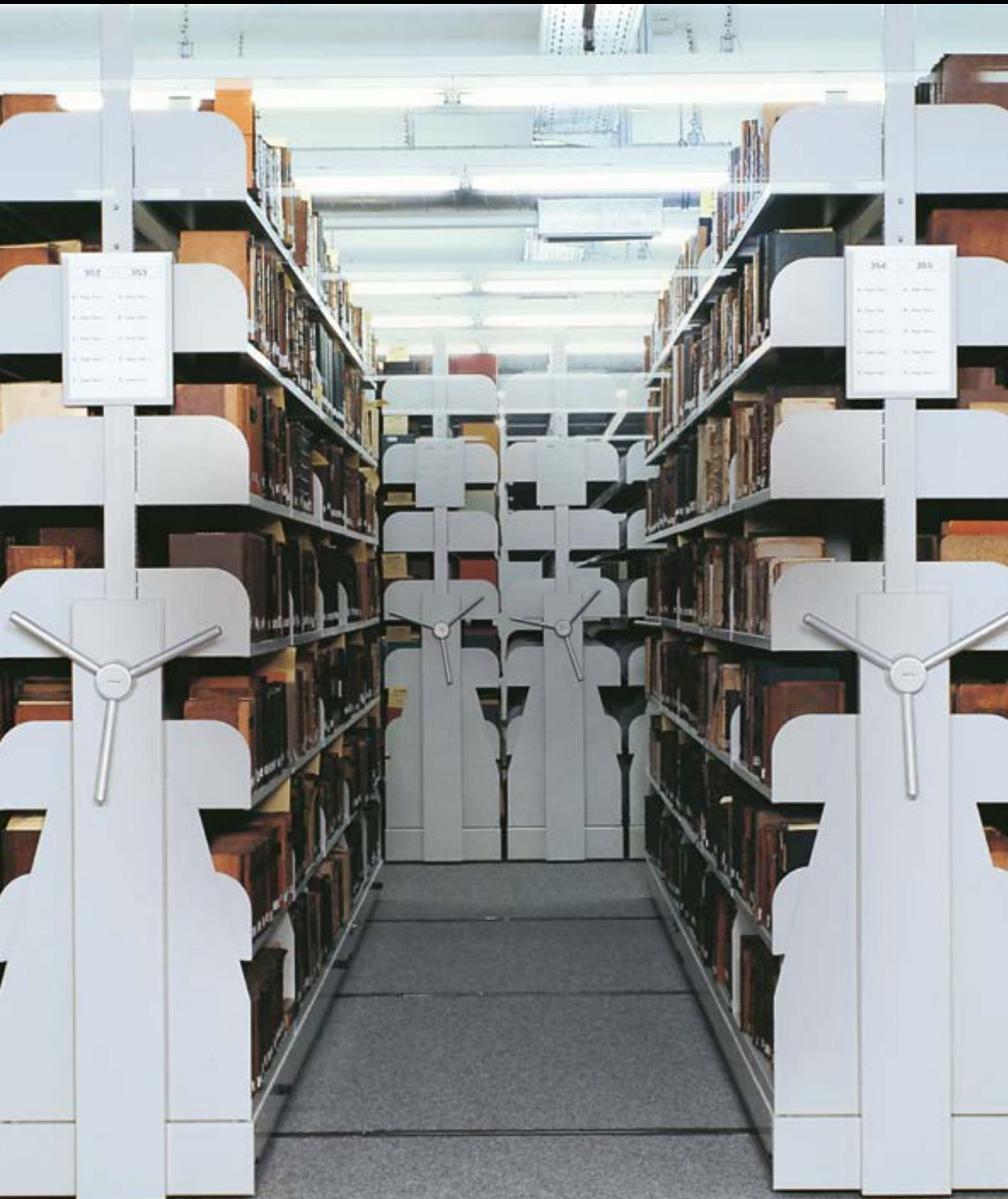
Referenz: Universitätsbibliothek Göttingen.