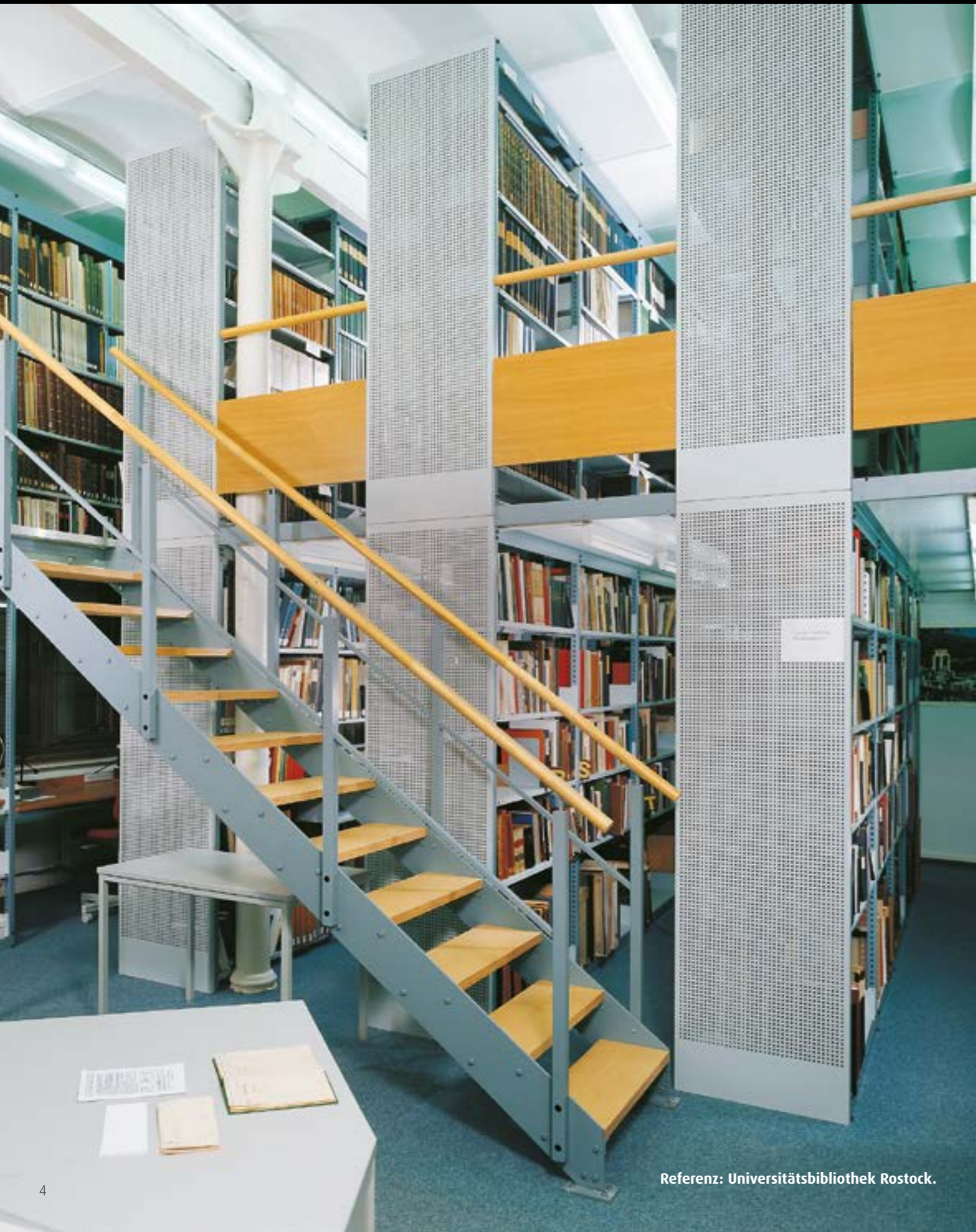
Referenz: Universitätsbibliothek Rostock.